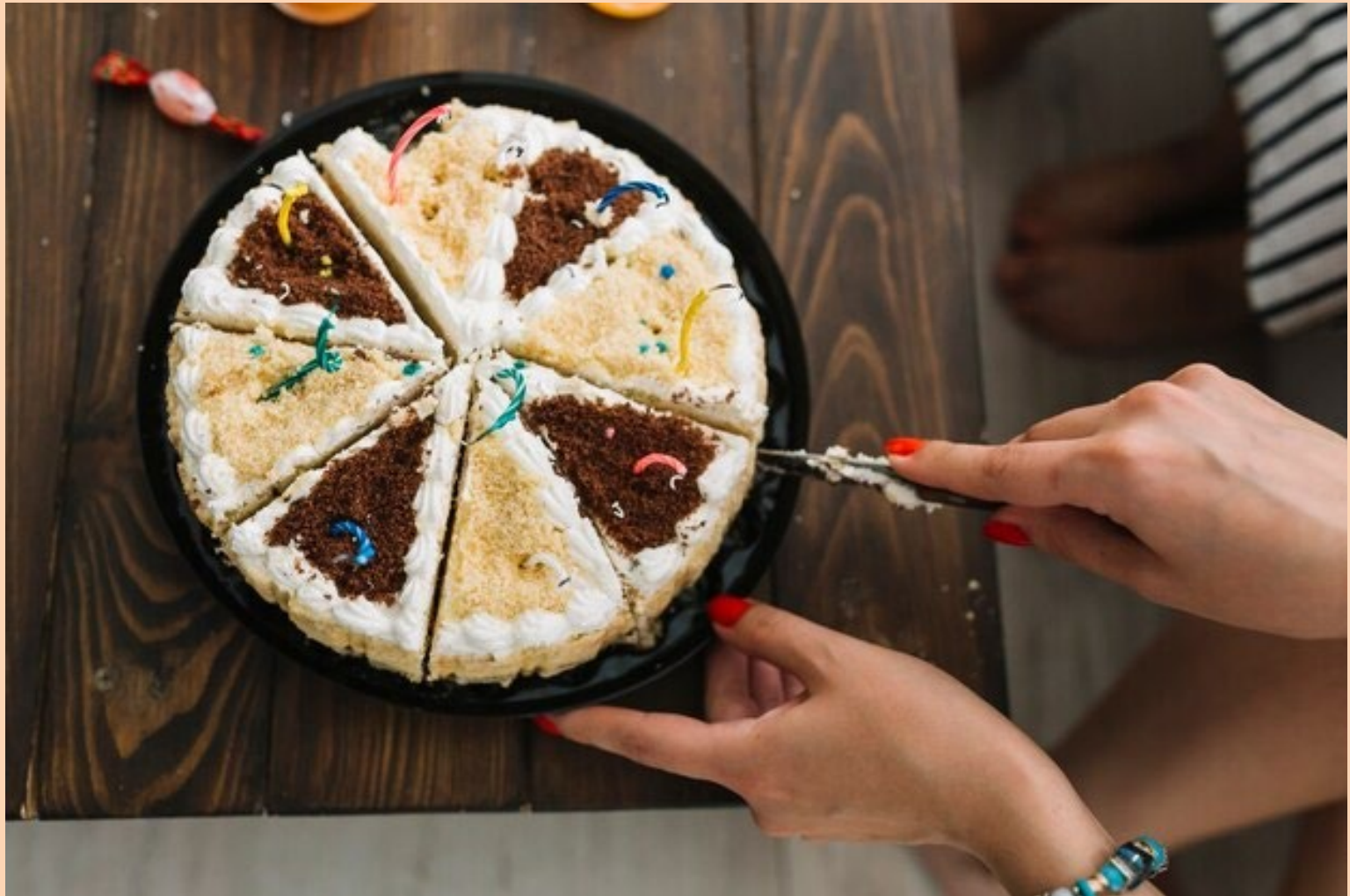
Zwei Frauen beim Kuchenschneiden